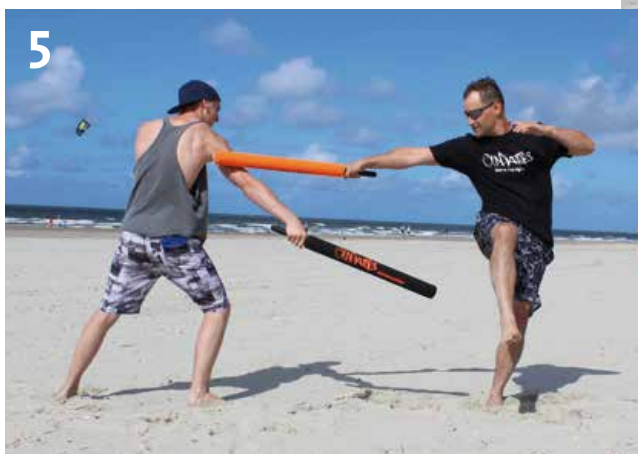
5) Von hier aus kontert er zum entblößten Arm.

Vielen Dank an Geoffrey Huth, Sabrina Güttner hinter der Kamera und Norderney für die tolle Kulisse!