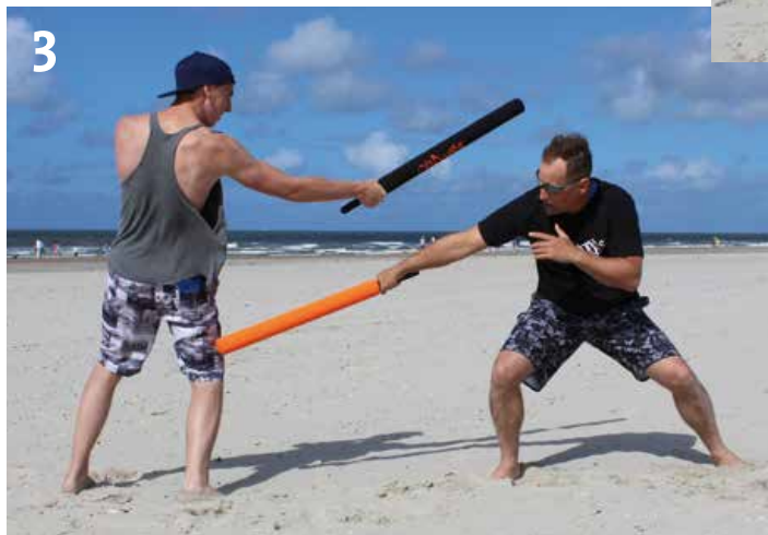
3) Von hier aus wechselt er die Ebene und greift mit einer tiefen Rückhand das Bein an.